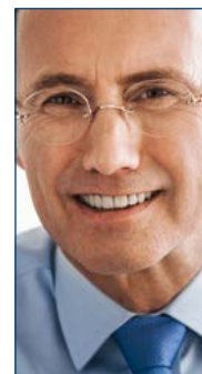
Dr. Othmar Karas, M. B. L.-HSG, Erster Vizepräsident des Europäischen Parlaments Tel.: +32 (0)2 2845627 Fax: +32 (0)2 2849627 www.othmar-karas.at E-Mail: othmar.karas@europarl.europa.eu Twitter: @othmar_karas Facebook: othmar_karas Instagram: @othmar_karas